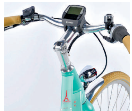
Das Cockpit mit dem verstellbaren Vorbau. Am Oberrohr sichtbar: der Eiffelturm.