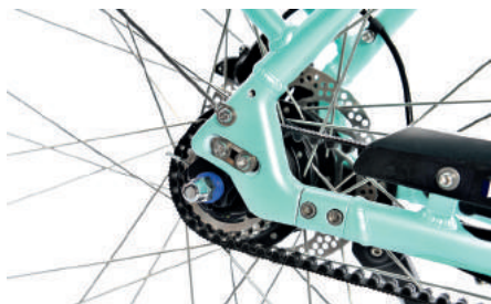
Der Gates Riemenantrieb macht eine Rahmenöffnung notwendig.

2017 stellt die ZEG – wie in 2016 – eine Modellserie unter ein Motto: nach Italien diesmal Frankreich. Macaron ist ein französisches Baisergebäck aus Mandelmehl mit einer cremigen Füllung; das Macaron E, ein Pedelec für die Stadt mit einem Trapezrahmen aus Alu und einer edlen, sehr wertigen Optik. Eine matte mintfarbene Perlmutterlackierung überzieht den Rahmen, den hier sogar (vorbildlich) angeschweißten Gepäckträger und die Starrgabel. Auch technisch kann das Macaron viel bieten: Der Bosch „Active Line“-Mittelmotor ist nach oben geneigt. So erzielen die Pegasus-Entwickler einen kurzen Radstand, mehr Bodenfreiheit und eine schöne Linie in Kombination mit dem aufs Unterrohr aufgesetzten Akku. Dieser ist ebenfalls harmonisch in das Farbkonzept